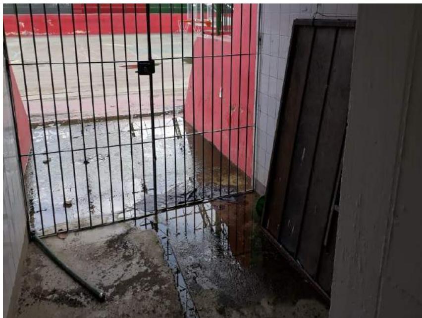
Acesso à quadra – Colégio Municipal Álvaro Lins