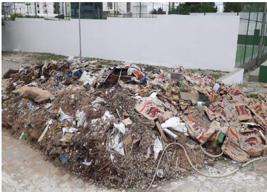
Entulhos – Colégio Municipal Álvaro Lins