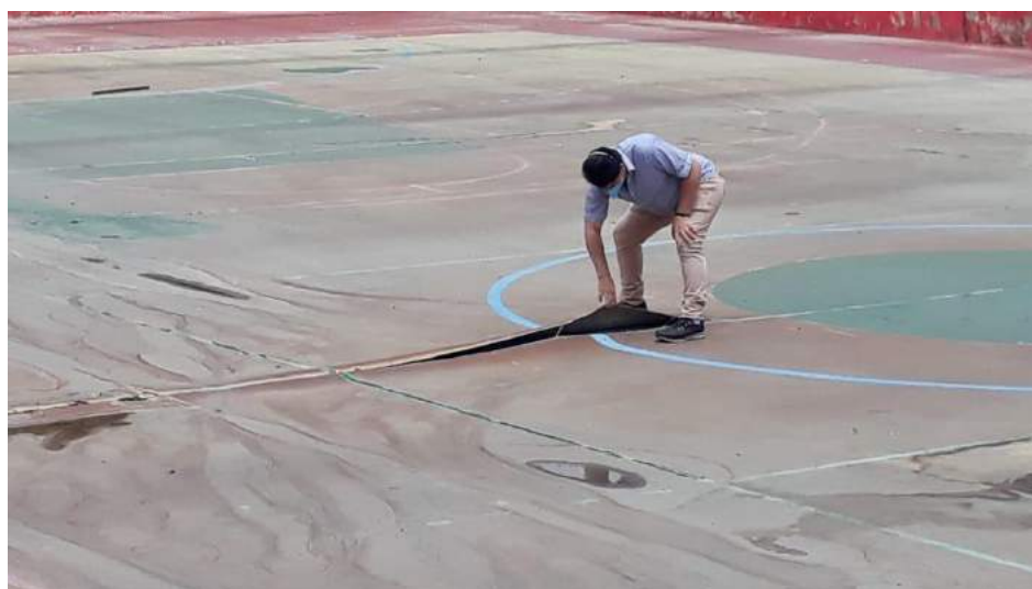
Sem coberta, acabou desgastando o piso por conta das chuvas