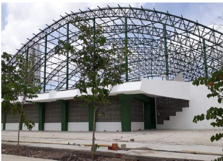
Teto da Quadra – Colégio Municipal Álvaro Lins