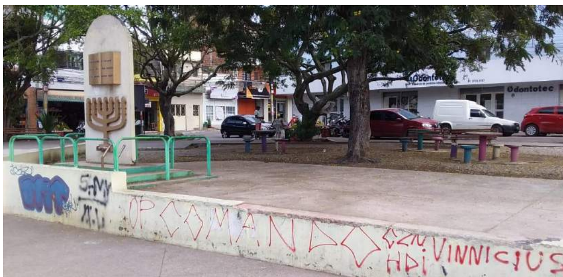
Praça Nova Euterpe (não tem obra)