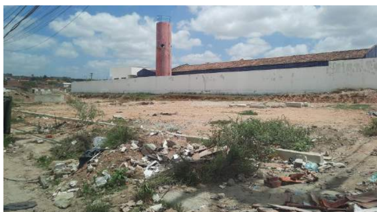
Foto tirada no dia 02 de abril de 2021 no momento não tem obras no local