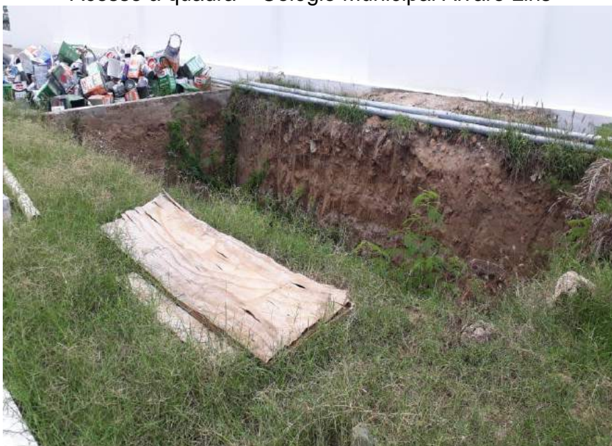
Cisterna não concluída