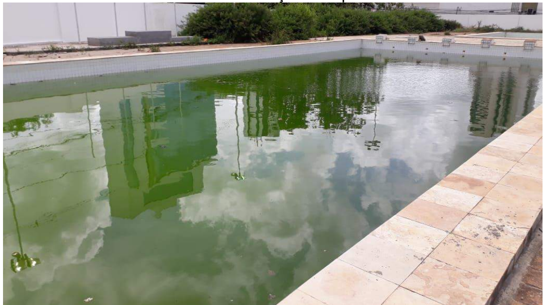
Piscina sem limpeza – Existindo empenhos para materiais de limpeza