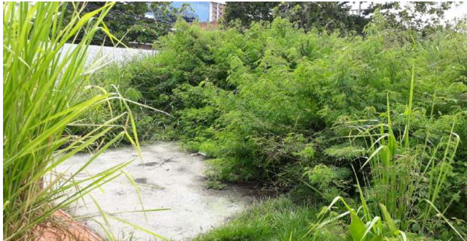
Falta de manutenção e limpeza