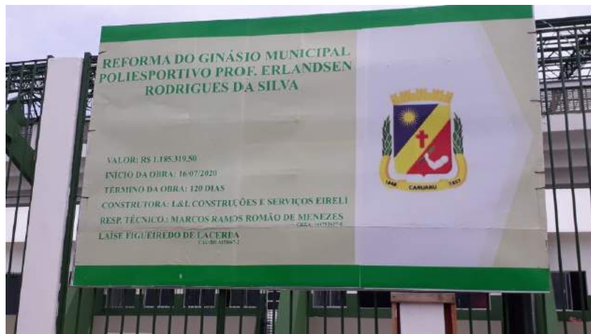
Obra atrasada conclusão prevista era novembro de 2020